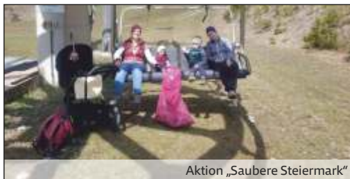
Aktion „Saubere Steiermark“