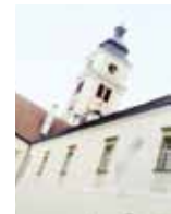
Stiftsbasilika Lilienfeld im Cellarium Freitag, 31. Mai 2013, 19.30 Uhr Stimmungsbilder – Harfenkonzert

Konzerte von Mai bis September 2013 in Kaumberg, Neuhaus, Altenmarkt, Lilienfeld, Annaberg und Mitterbach