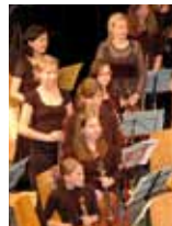
Glassalon Neuhaus/Weissenbach Freitag, 27. September 2013, 19.00 Uhr Herbstserenade