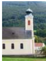
Pfarrkirche Altenmarkt Freitag, 24. Mai 2013, 20.00 Uhr Petersburg Singers