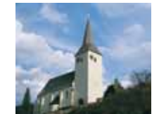
Pfarrkirche Kaumberg Samstag, 7. September 2013, 19.30 Uhr Welcome in Gospels and more