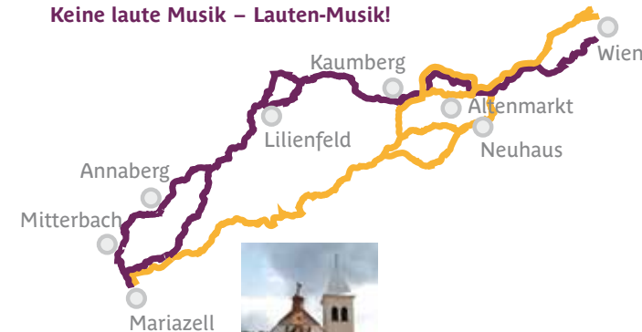
Pfarrkirche Annaberg Donnerstag, 15. August 2013, 19.30 Uhr Keine laute Musik – Lauten-Musik!