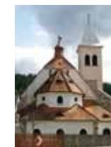
Katholische Pfarrkirche Mitterbach Freitag, 30. August 2013, 19.00 Uhr Geistliche Musik der Romantik