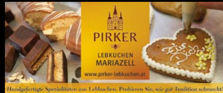
Handgefertigte Spezialitäten aus Lebkuchen. Probieren Sie, wie gut Tradition schmeckt!